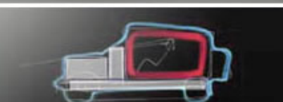
DISPOSIZIONE DEI VOLUMI NELL'AUTO DEL PASSATO

A meno di una settimana dall'apertura al pubblico del Salone di Ginevra, dove debutterà, mettiamo insieme i pezzi del "puzzle" Sintesi. L'ultima realizzazione della Pininfarina, infatti, è stata svelata poco per volta, attraverso cinque dépliant elettronici , da cui sono state tratte le immagini qui a fianco e nella galleria fotografica.